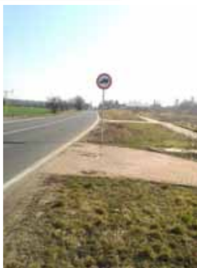
Vladimír Bílek, vedoucí oddělení dopravy OŽPD ÚMČ Praha 19

Dodržování dopravního značení pravidelně kontroluje městská policie.