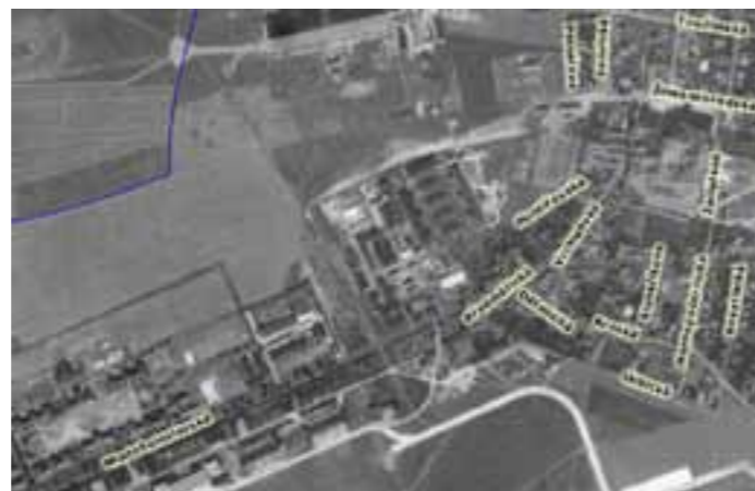
Nejstarší známý letecký snímek, zachycující poválečný stav areálu PAL (mírně vpravo nahoře). Na sousedním letišti jsou již vidět zpevněné pojezděcí dráhy. Rok 1953.

Kunovice ležely již za linií nejzazšího možného doletu německých bombardérů (když ovšem nikdo nepočítal s tím, že Hitler nejprve obsadí Rakousko). Jenže přestěhování natolik rozběhnuté výroby bylo mimořádně obtížné a až do mnichovské konference šlo o to, aby náš zbrojní průmysl nebyl ničím sebemeně oslaben. Proto se přemístění stále oddalovalo. Kdyby bývala již najížděla výroba v Kunovicích a ustávala ve kbelsko-letňanské zóně, nebyl by býval Hitler přišel zdaleka tak k hotovému, jako se stalo. Jenže to jsou pověstná historická »kdyby«.