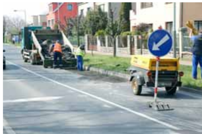
Vladimír Bílek, vedoucí oddělení dopravy OŽPD ÚMČ Praha 19

aby byla zachována bezpečnost na těchto komunikacích. V těchto dnech byly ze strany TSK zahájeny práce na odstranění závad, což dokumentuje foto z opravy komunikace Toužimská.