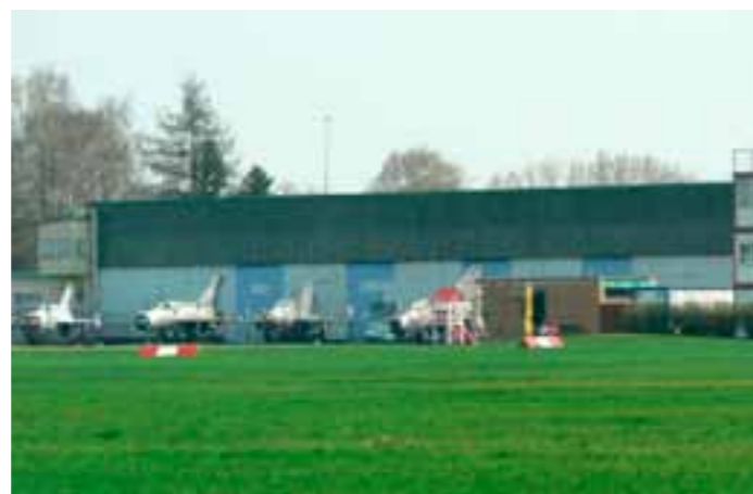
Montážní hangár v areálu Staré Aerovky, vybudovaný německými okupanty v roce 1941. Současný stav.

tak nakonec osud tohoto špičkového letounu končí v roce 1941, když bylo postaveno jen asi něco kolem deseti kusů. Československé vedení se totiž před okupací dopustilo jedné chyby. Už po roce 1935 se v Kunovicích u Uherského Hradiště začal budovat obří průmyslový komplex, kam se veškerá letecká výroba měla odsunout. Proč právě tam?