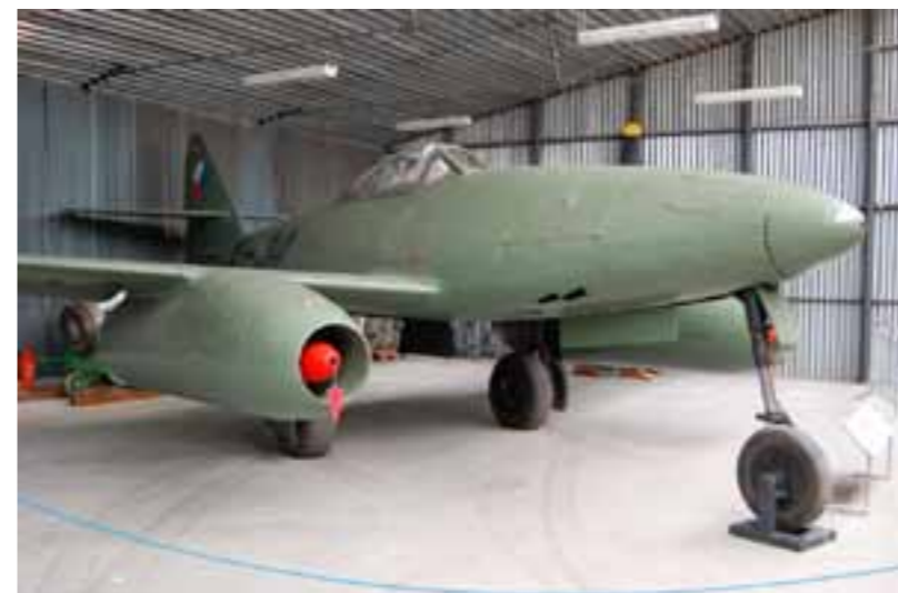
Proudový stíhač S-92 (Messerschmitt 262 vyrobený v Avii) ve sbírkách leteckého muzea.

Zajímavé ale je, že Němci natolik nedůvěřovali českým pracovníkům, že žádný z bojových letounů nenechali