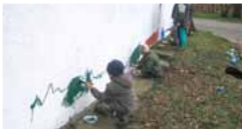
Šárka Egrtová, public relations ÚMČ Praha 19