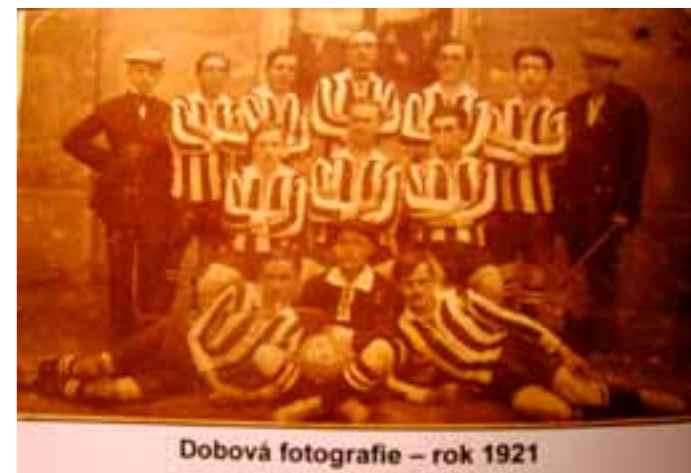
Dobová fotografie – rok 1921